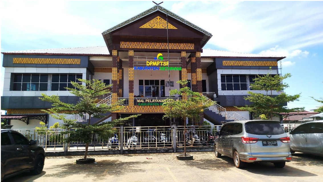
Gambar Gedung DPMPTSP / Mal Pelayanan Publik

perluasan bangunan untuk penyediaan kebutuhan ruang kerja, ruang arsip dan gudang penyimpanan dokumen SPJ PD.